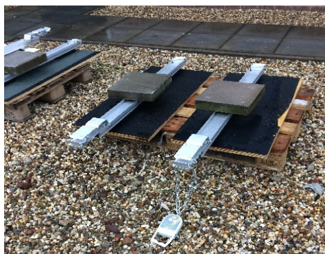
Meting wrijvingscoëfficiënt voeten